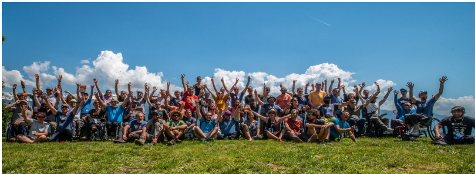
Crédits : Alexis Benoit – Pilotes et bénévoles de la 1 ère Hand'Icare cup

Elle sera annoncée à l'occasion de la 46 ème Coupe Icare, fin septembre à Saint Hilaire évidemment.