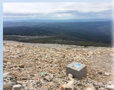
Exemple de « pierre parlante »